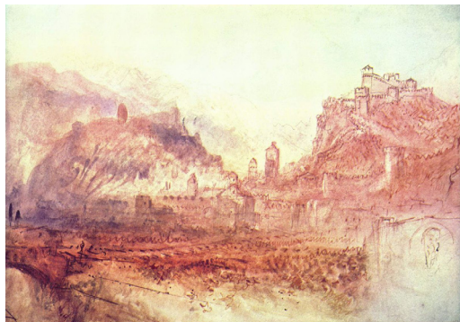
Bellinzona, peinture par Joseph Mallord William Turner, 1843.

Inscrits à l'UNESCO depuis 2000, les châteaux de Bellinzona forment un système fortifié d'origine médiévale. Edifiés sur un site stratégique, le long de la route du St. Gothard, l'une des principales voies de communication traversant les Alpes, ils ont atteint leur structure actuelle grâce aux ducs de Milan (XVe siècle) qui ont réalisé un système de défense pour barrer la vallée du Ticino et contrer l'avancée vers le sud des Confédérés helvétiques.